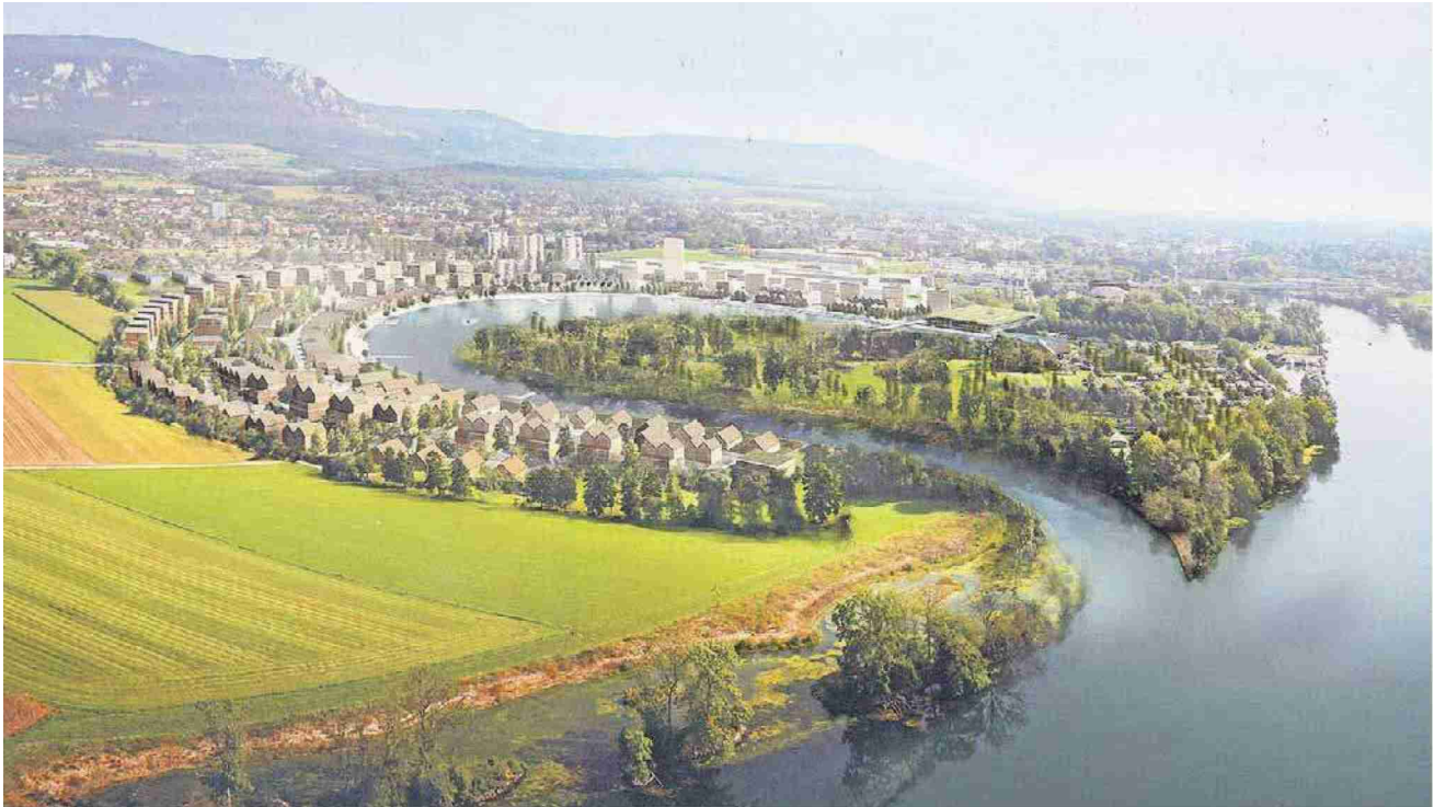
Die Wasserstadt kommt im Stadtentwicklungskonzept einigen Gemeinderatsmitgliedern zu stiefmütterlich daher.

Themen-Nr.: 818.006 Abo-Nr.: 1088641 Seite: 26 Fläche: 61'981 mm 2